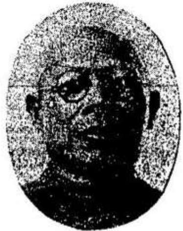
ព្រះពោធិវង្ស

វិនិច្ឆ័យញា “ហុត-តាត” ចាងហ្វាងពុទ្ធិកវិទ្យាល័យព្រះ សុក្រមិត