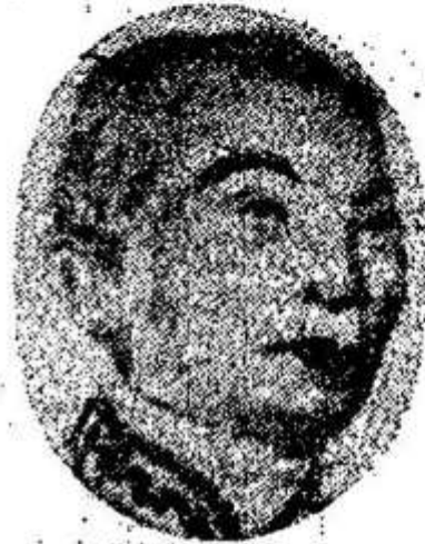
ព្រះបាទសម្តេចព្រះនរោត្តម Prah Norodom