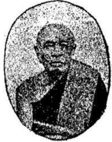
សម្តេចព្រះមង្គលទេពាចារ្យ កន្ទួត "អៀម" Samdach Pras Mongkuldebachar "Fim"