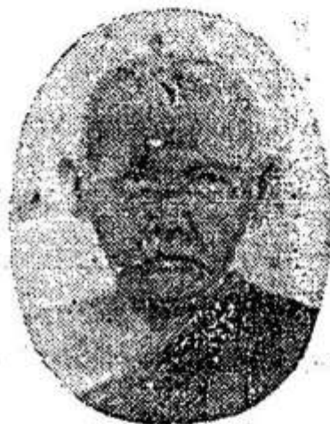
សម្តេចព្រះធម្មសិទ្ធិតន្ត្រកេរ កែ.ក្អក Samdach Pras Dhammalikkhit "Ker-Ouk"