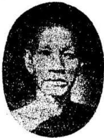
ព្រះវិមលធម្ម “ថោង”

វត្តឧណ្ណាលោម ជាសាស្ត្រាចារ្យ ឯកទ្វេសង្ខេបព្រះត្រៃបិដកជាន់ ដើម ។