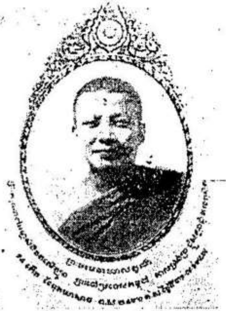
ព្រះបាទសម្តេចព្រះនរោត្តមសីហនុវរ្ម័ន កាលទ្រង់ព្រះផ្លូវ King Sihanouk as Buddhist monk