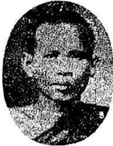
ព្រះឧត្តមមុនី “អ៊ុមស៊ូ”

វត្តឧណ្ណាលោម អតីតអធិបតីរង នៃក្រុមផ្តុំប្រែព្រះត្រៃបិដក Pras Uffamanzuni « Uum-Sou »