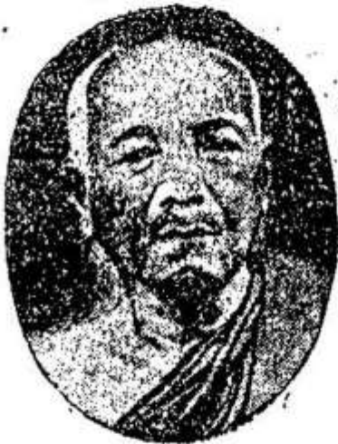
សម្តេចព្រះមង្គលទេពាចារ្យ បញ្ចទំពោ "ស៊ុក" Samdach Pras Monkuldebachar "Souk"