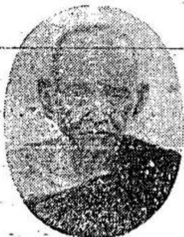
សម្តេចព្រះមហាសុបេតានិបតិ បន្ទូក្រោម ប្រាក់.ហ៊ុន Samdach Pras Maha Sumedhaddipadey "Prak-Hun"