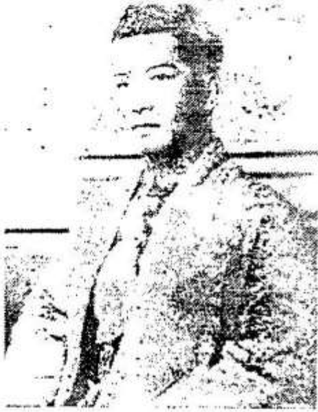
ព្រះបាទសម្តេចព្រះនរោត្តម សីហនុ វរ្ម័ន Prah Norodom Sihanouk