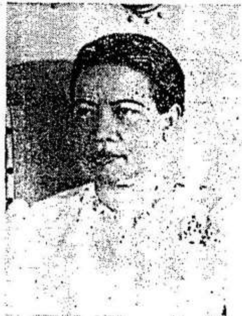
សម្តេចព្រះមហាក្សត្រីយានី Prah Moha Kossamak