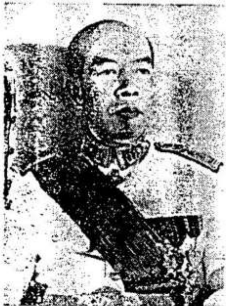
ព្រះបាទសម្តេចព្រះនរោត្តមសុរាម្រឹត Prah Norodom Suramarith