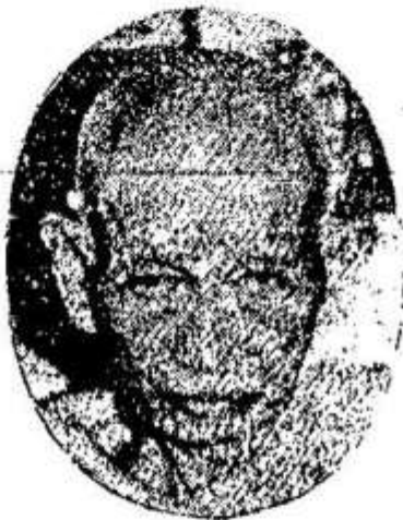
សម្តេចព្រះធម្មលិខិតឧត្តមប្រឹក្សា វត្តលង្កា “លី-ឯម” អតីតអធិបតីក្រុមផ្តុំប្រែព្រះត្រៃ បិដក

វត្តឧណ្ណាលោម អតីតអធិបតីរង នៃក្រុមផ្តុំប្រែព្រះត្រៃបិដក Pras Uffamanzuni « Uum-Sou »