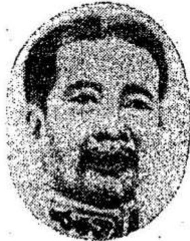
ព្រះបាទសម្តេចព្រះស៊ីសុវត្ថិមុនីវង្ស Prah Sisowath Munivong