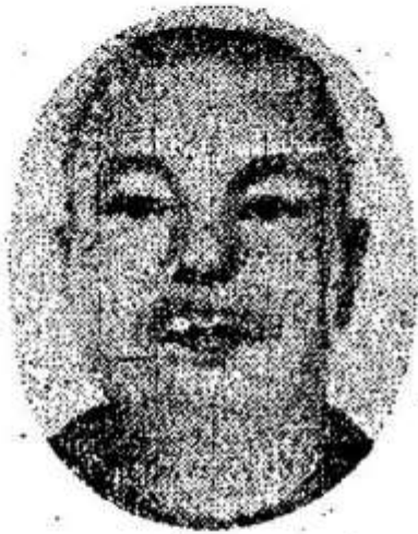
ព្រះបាទសម្តេចព្រះហរិរាជ្យរាមា ព្រះអង្គឌួង Prah Ang Duong