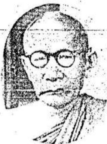
សម្តេចព្រះមហាសុបេតានិបតិ ខោតញ្ជ័រណ ដូន.ណាត Samdach Pras Maha Sumedhaddipadey "chun-Nath"