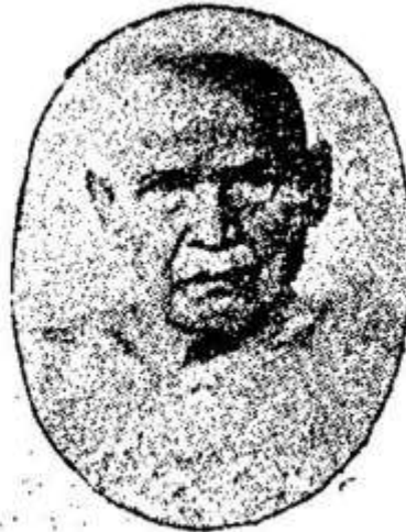
សម្តេចព្រះសុធម្មតិបតី ពុទ្ធនាគោ "អ៊ុង-ស្រី" Samdach Pras Sudhammathipadey "Ung-Srey"