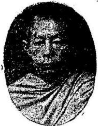
ព្រះមហាព្រហ្មមុនី “អ៊ូ”

វត្តស្វាយពពែ អធិបតីរងនៃក្រុម ផ្តុំប្រែព្រះត្រៃបិដក