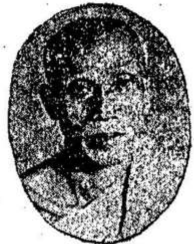
សម្តេចព្រះសុធម្មតិបតី ឥន្ទ្រញាណោ "ភូល-ទេស" Samdach Pras Sudhammathipadey "Phoul-Tes"