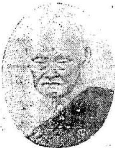
សម្តេចព្រះសង្ឃរាជ និល.ទៀង Samdach Sankharach "Nih-Tiang"

CHIEF OF MAHANIKAYA ORDER from origine to present time