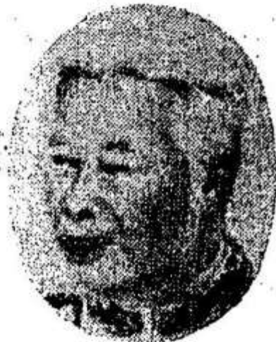
ព្រះបាទសម្តេចព្រះស៊ីសុវត្ថិ Prah Sisowath